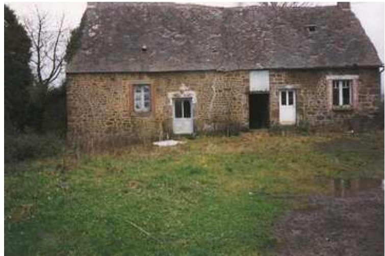
Fermette à restaurer, cadre rural

2 semi-detached houses creating 1 country house to restore with approximately 3,060 sqm of land. 1 st house: living room with chimney, 2 store rooms and attic overhead; 2 nd house living room with chimney, store room and attic overhead. The attic would provide ample space for 2 bedrooms and a bathroom and has good headroom. Pretty setting in a peaceful rural setting in a country hamlet with the appearance of isolation but with shops and tourist activities only 2-3 km away. 1.5 hours from St Malo. Please note, the photos were taken in 2006.