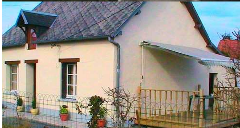
Maison de campagne proche Torigni sur Vire