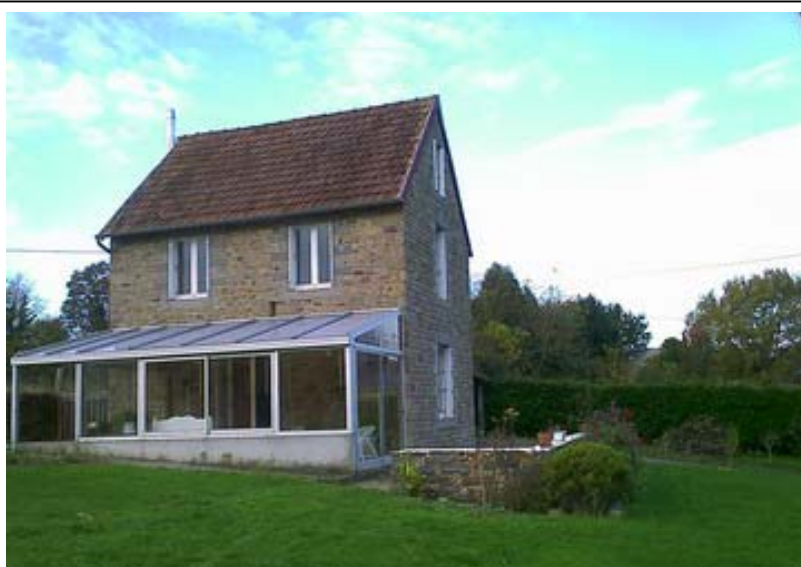
Maison de campagne – cadre rural

Stone built house with tiles roof in a really pretty setting, only 10 minutes walk to La Haye Pesnel but in the country, in a small hamlet: hall, living room with efficient modern woodburner, fitted kitchen, laundry and conservatory. 1 st floor: landing, 2 bedrooms, WC with hand basin, 2 nd floor: large bedroom. Sheds. Approximately 861 sqm land. All in good condition, easy maintenance.