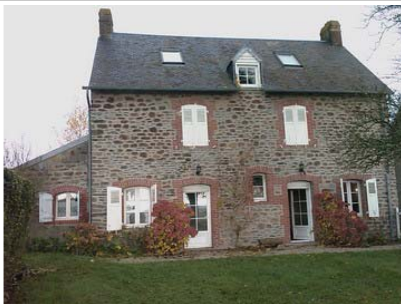
Maison de campagne – vue sur les grèves de la Baie du Mont St Michel

Traditional country house, built in stone, with a slate roof, overlooking the Bay of Mont St Michel with to die for views. Approximately 105 sqm of internal living space. Ground Floor: Kitchen / diner with chimney, sitting room with large stone fireplace, shower room, WC, store room. 1 st floor: landing, 2 bedrooms. 2 nd floor: bedroom. Approximately 445 sqm land. This property is what location location location is all about!