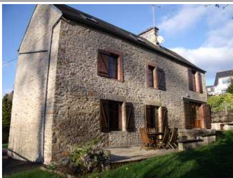
Maison de charme au calme à proximité des commerces

Traditional stone house in a charming quiet area of Avranches within walking distance of central Avranches but with a feeling of being in the country. Ideal for a family as all facilities (schools etc) are within walking distance. Ground floor: large living room with stone chimney, fitted kitchen. Both living room and kitchen have access to the south facing terrace. First floor: 2 double bedrooms, large family bathroom with WC, dressing room. 2 nd floor 2 double bedrooms, wc with sink, attic. Double garage. Gardens with south facing terrace overlooking the former "lavoir" and without being overlooked. Approximately 945 sqm